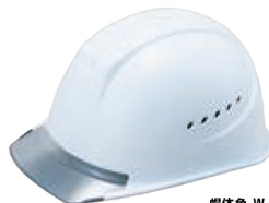
帽体色 W-3 ひさし V-2