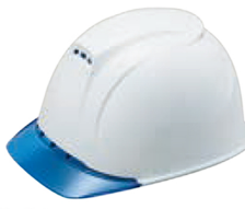
帽体色 W-1 ひさし V-5